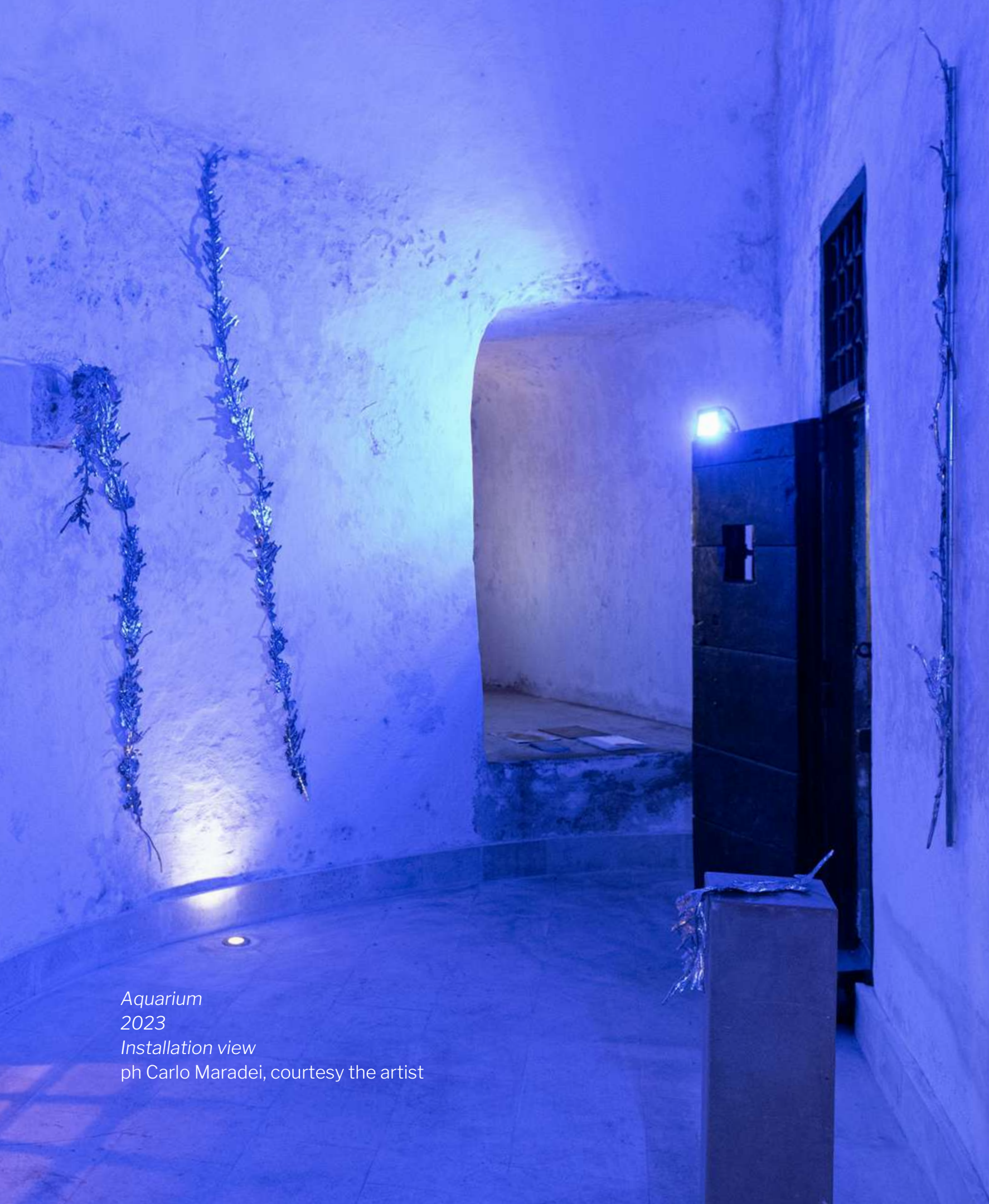
Aquarium 2023 Installation view