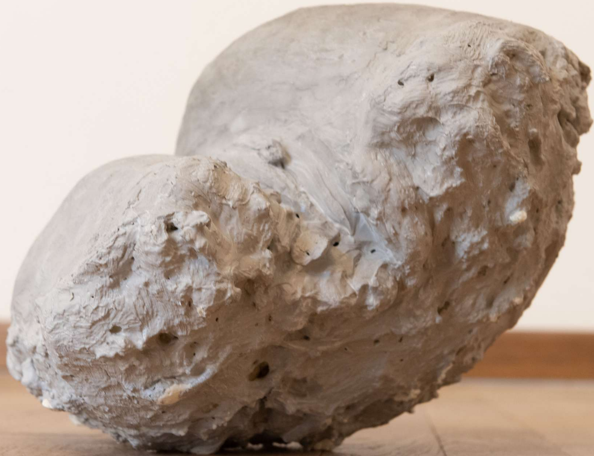
Prima pietra 2022 cemento, schiuma poliuretana cm 40x30x24

Prima pietra svela la natura femminile, composta da profondi atti di coraggio, anche quando ciò significa rivelare le proprie vulnerabilità.