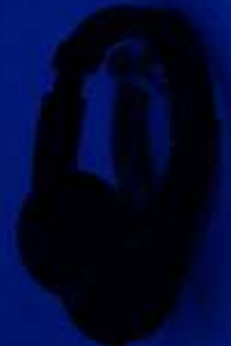
I will see you 2023 video (4:04)min, loop Installation view link video