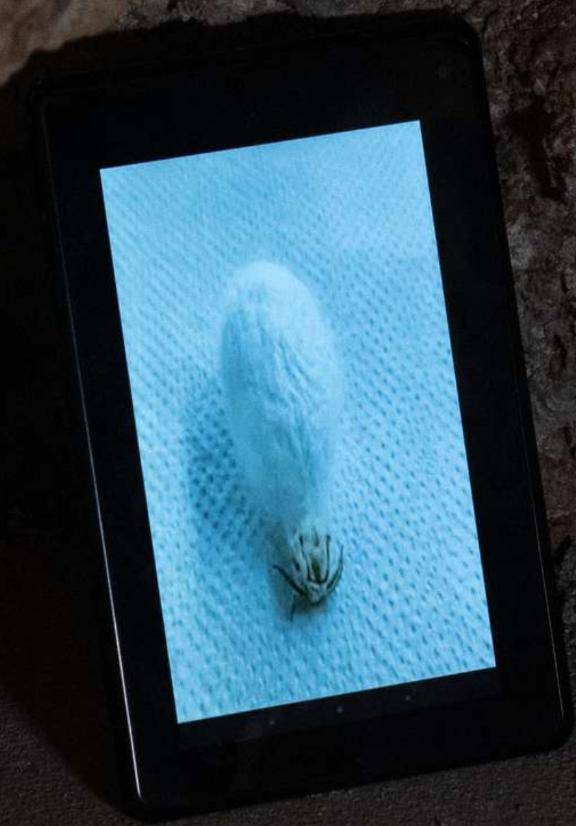
BackOne 2018 video (7:22min) installation view Castello Aragonese, Castrovillari (CS) link al video