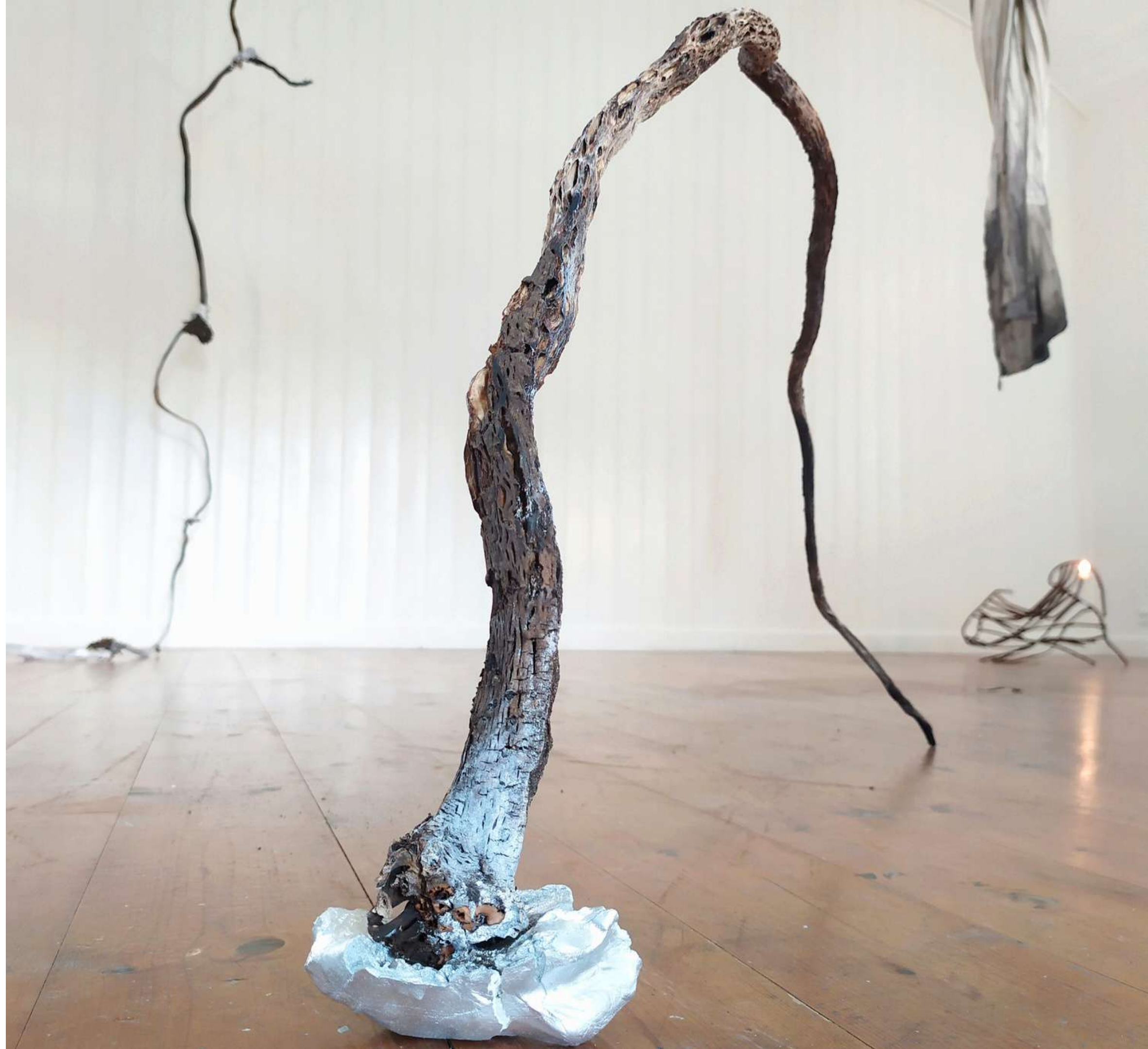
Herhúsið 2023 Icelandic Art Center Installation view