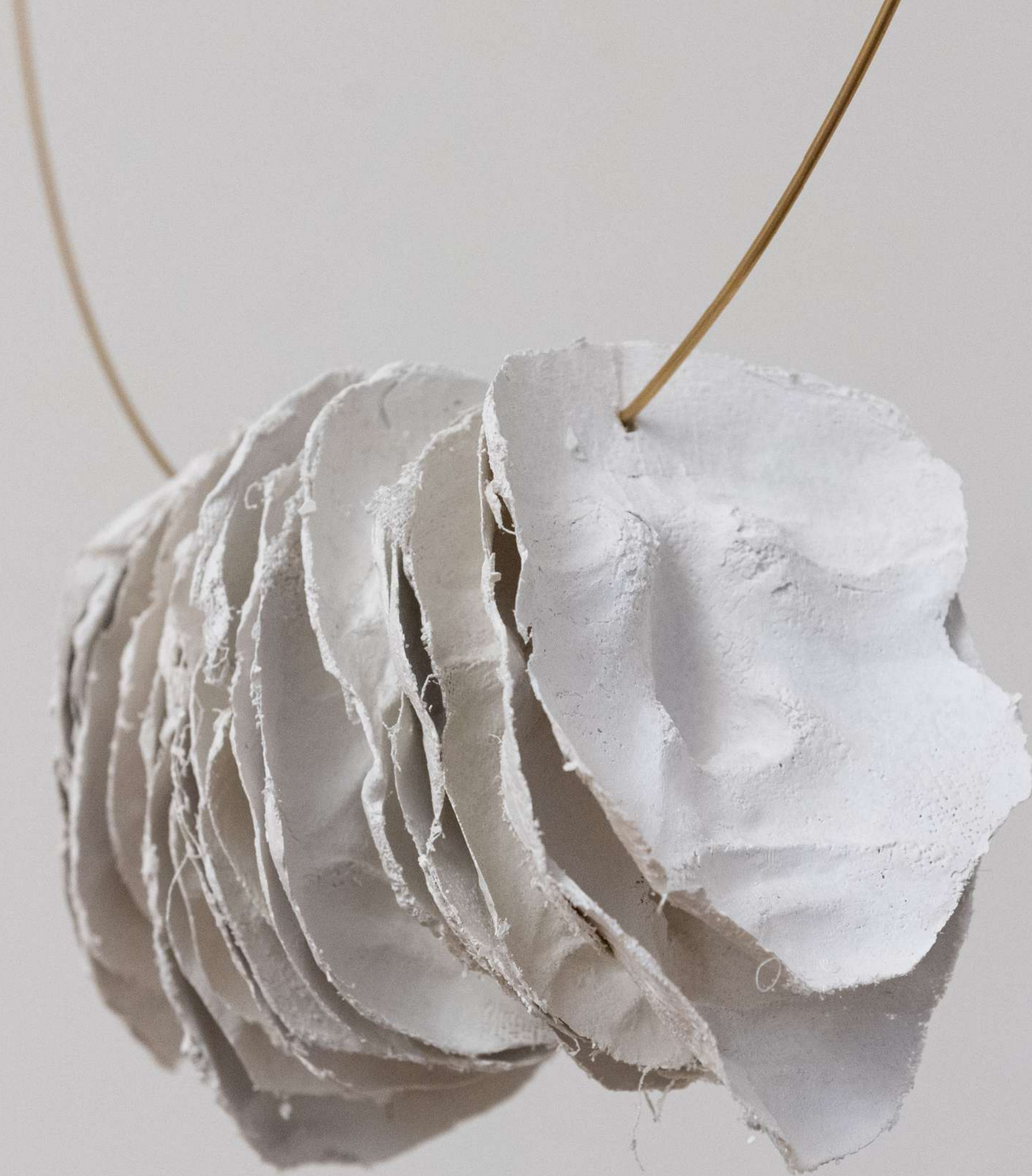
Adelaide 2022 bende gessate, asta di ottone, cm 60x150x20

Adelaide è un amuleto che riconcilia la relazione, non sempre idilliaca, tra madre e figlia.