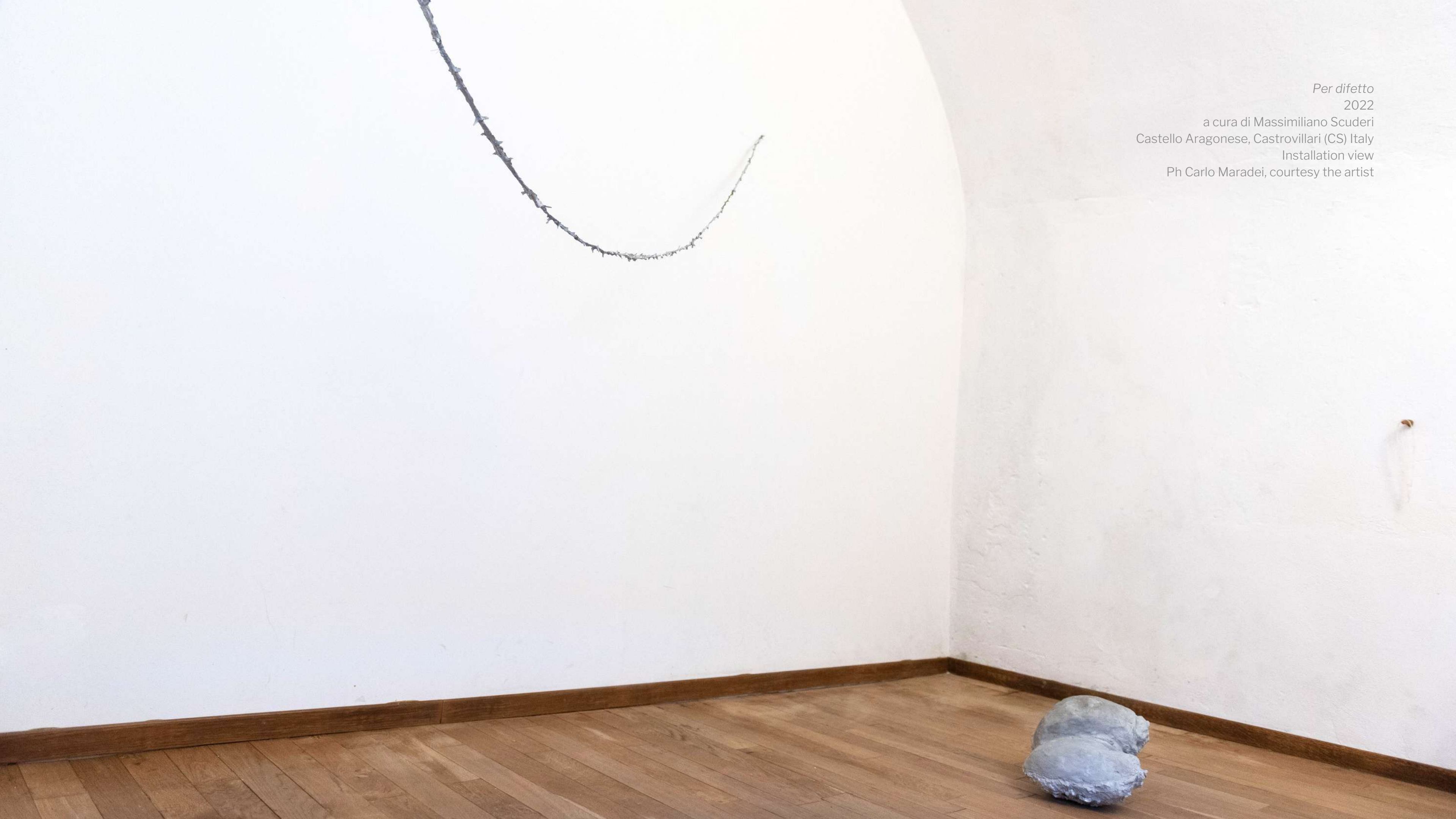
Per difetto 2022 a cura di Massimiliano Scuderi Castello Aragonese, Castrovillari (CS) Italy Installation view