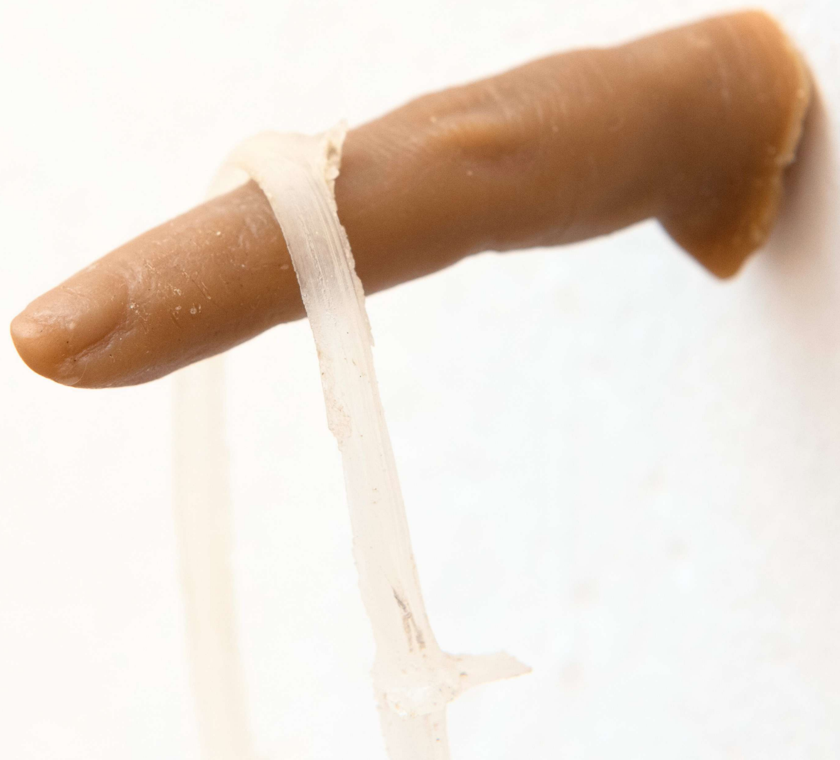
Drop 2022 cera d'api, resina cm 6x23x10