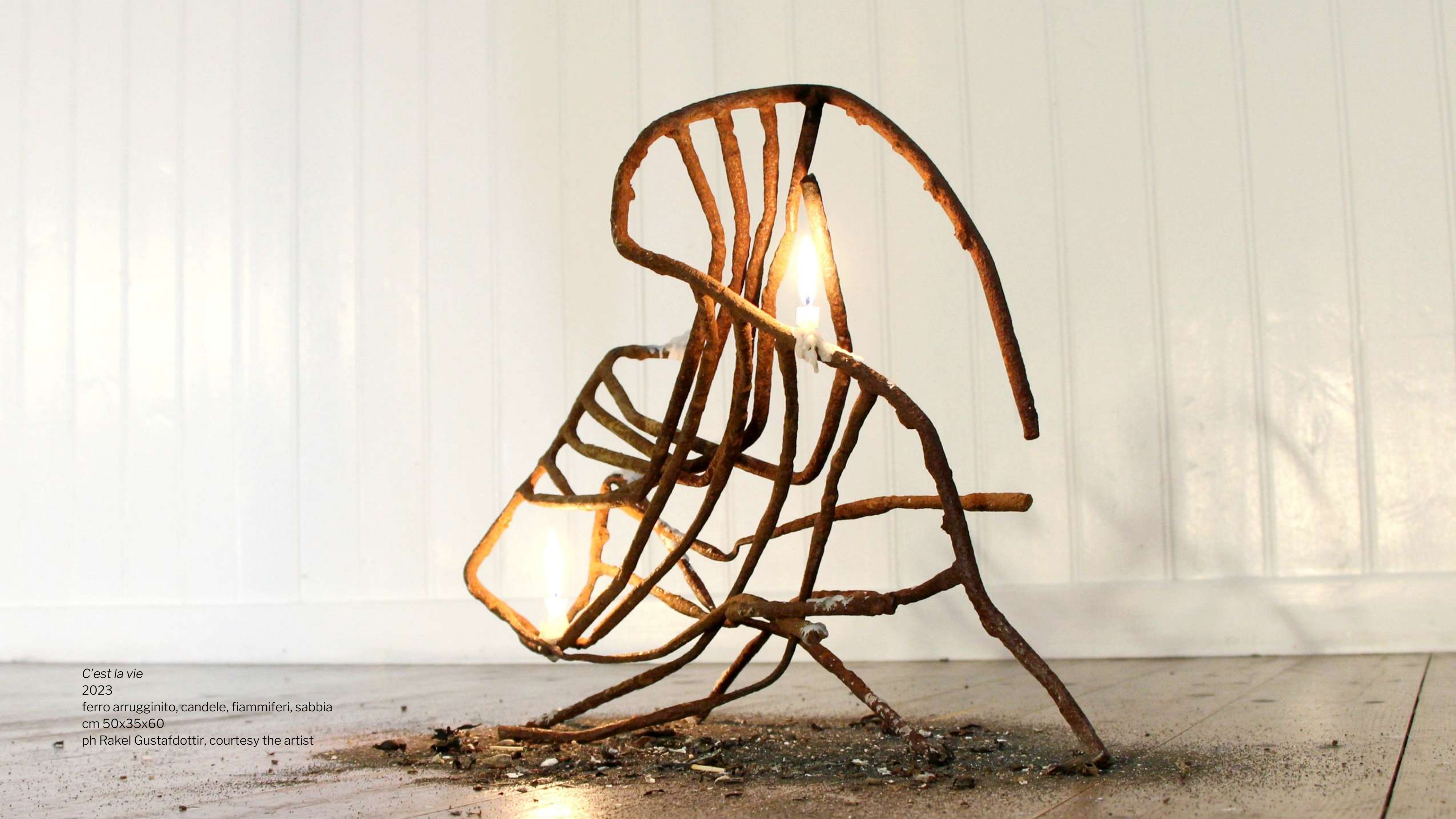
C'est la vie 2023 ferro arrugginito, candele, fiammiferi, sabbia cm 50x35x60