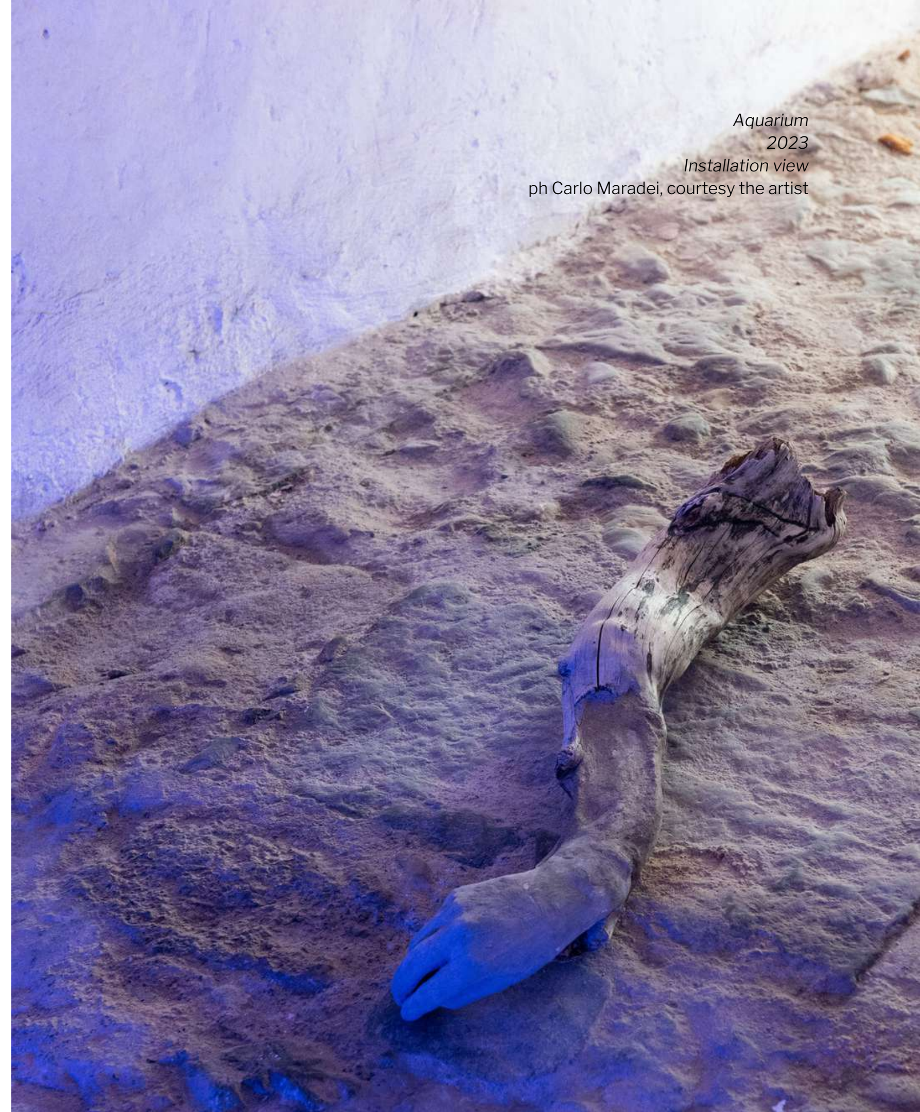
Aquarium 2023 Installation view