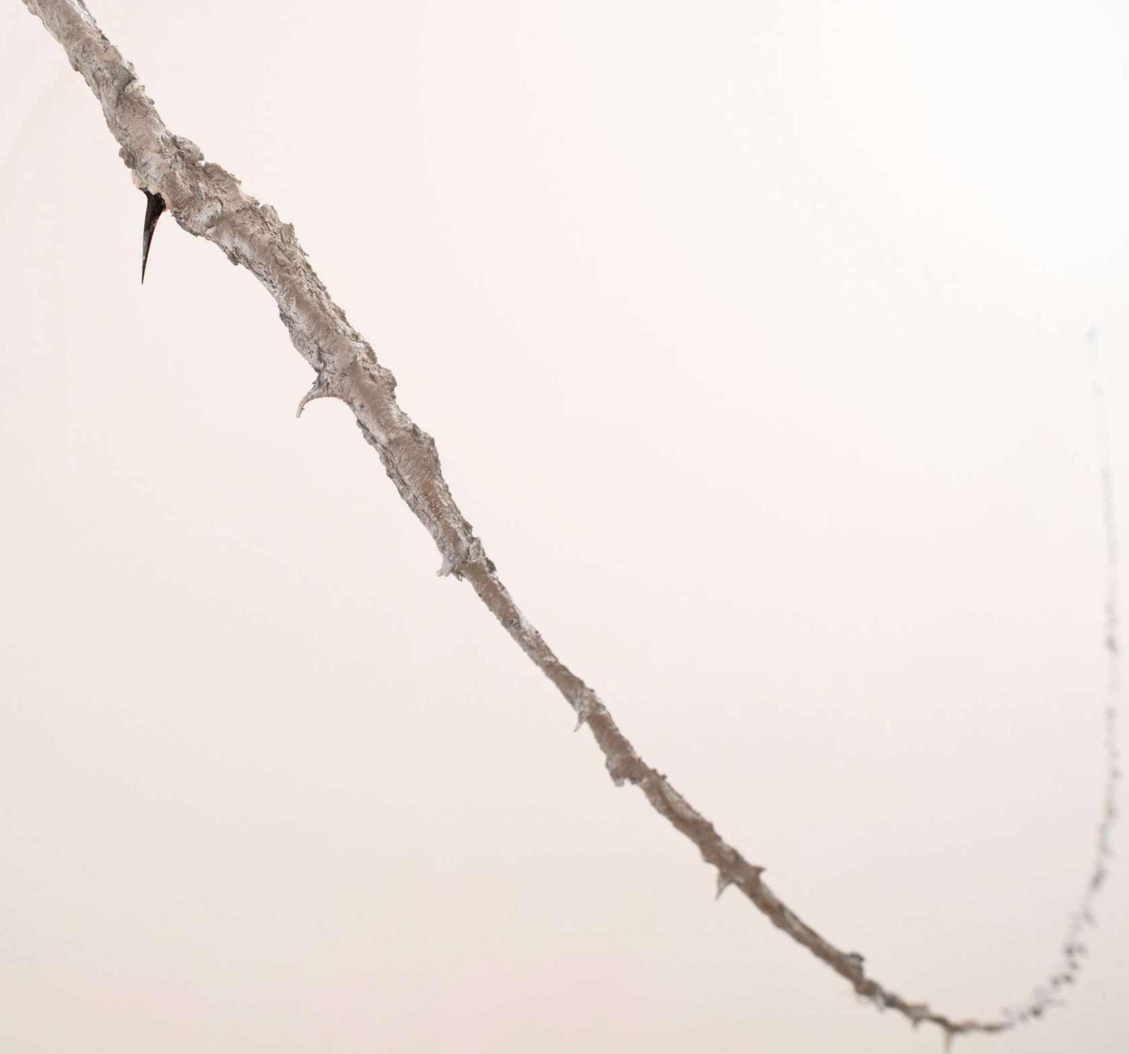
Discendent 2022 resina epossidica, Acacia Robinia, acrilico cm 320x2x1,5