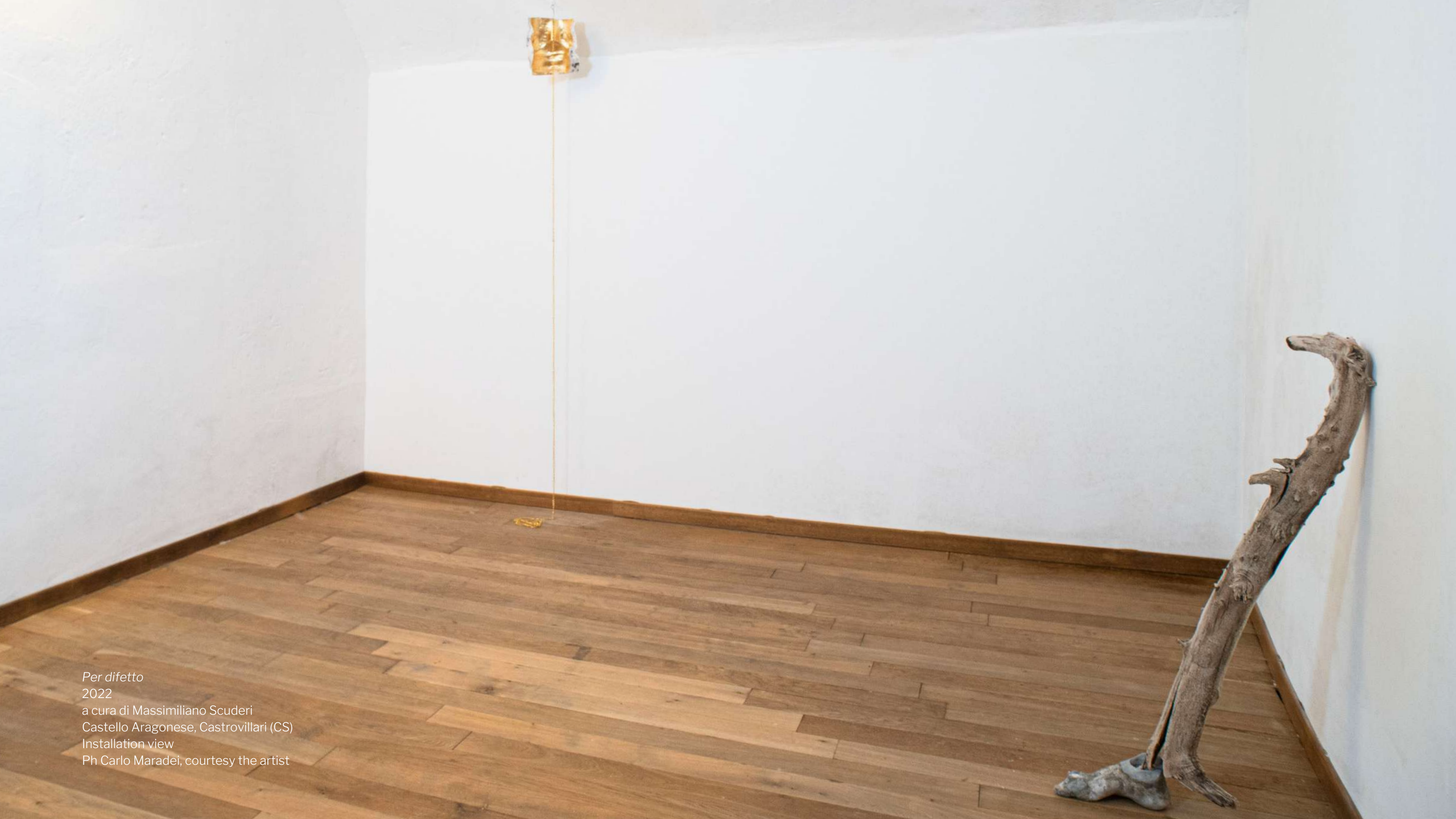
Per difetto 2022 a cura di Massimiliano Scuderi Castello Aragonese, Castrovillari (CS) Installation view